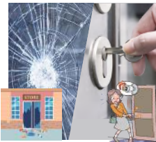
ガラス・カギの故障