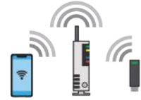
正常にインターネット接続確認完了