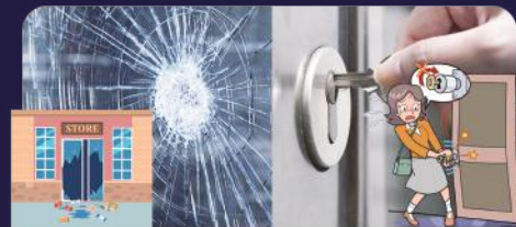
ガラス・内装・カギ・扉の故障