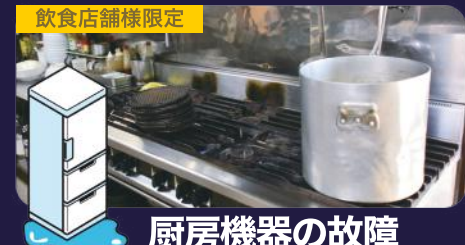
飲食店舗様限定 厨房機器の故障

※応急処置(一次対応)とは簡単な部品交換、トラブル自体を一時的に解決することです。